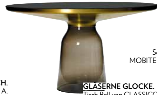
GLASERNE GLOCKE. Tisch Bell von CLASSICON, P. a. A.