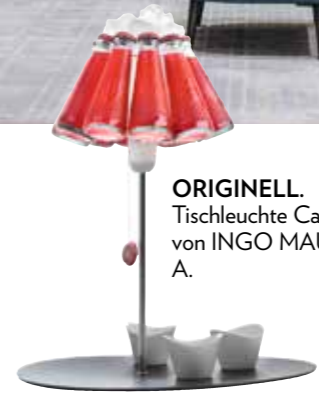
ORIGINELL. Tischleuchte Campari Bar von INGO MAURER, P. a. A.