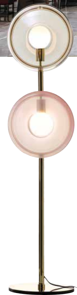
HELLAUF BEGEISTERT. Stehleuchte Orbital von BOMMA in Pink, Weiß und Gold, P. a. A.