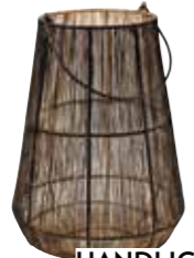
HANDLICH. Laterne aus Eisen, erhältlich bei HOME, P. a. A.