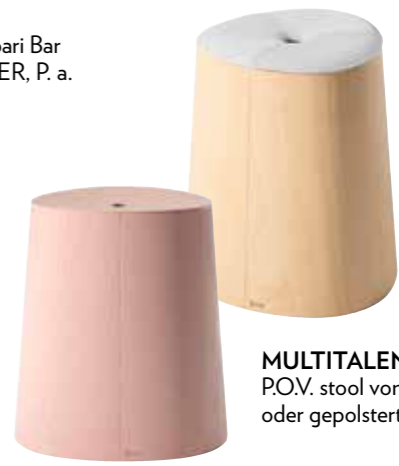
MULTITALENT. P.O.V. stool von TON als Beistelltisch oder gepolsterter Hocker, P. a. A.