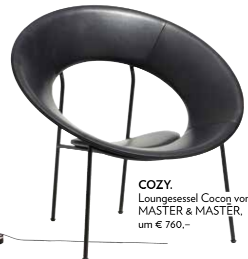
COZY. Loungesessel Cocon von MASTER & MASTER, um € 760,-