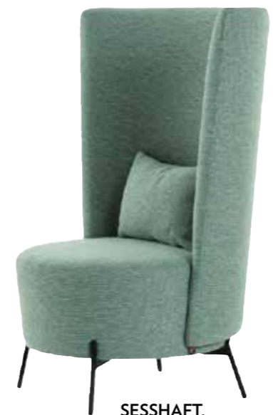
SESSHAFT. Sessel Bolero mit hoher Lehne von MOBITEC, erhältlich bei FÖGER, P. a. A.