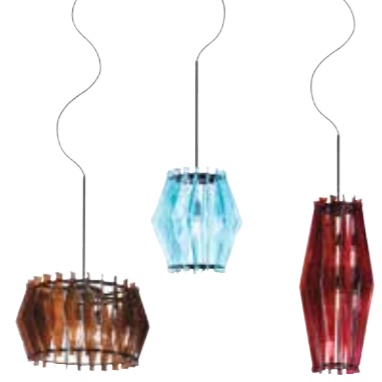
LICHTGEBER. Pendelleuchten aus buntem Glas von FREUDLING, P. a. A.