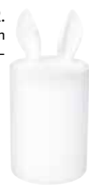
LAUSCHER. Häschen-Dose Curiosity von PETITE FRITURE, um € 45,-