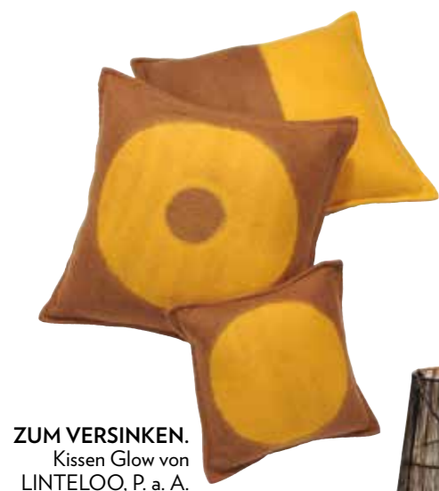
ZUM VERSINKEN. Kissen Glow von LINTELOO, P. a. A.